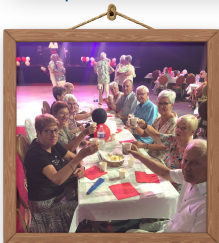
Marathon de la Danse