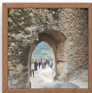
Sortie à Bargemon