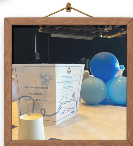
Bal de la Semaine Bleue