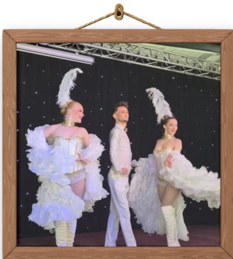
Cabaret à Tourves