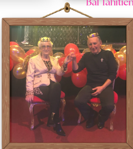
Bal de l'Épiphanie