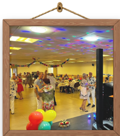
Bal Couleurs Créoles