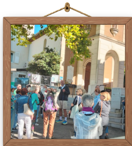
Sortie à Aubagne