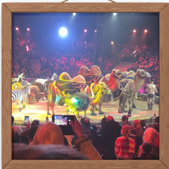
Cirque International de Monte Carlo